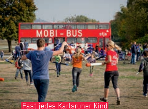
Fast jedes Karlsruher Kind kennt ihn: den MOBI-BUS